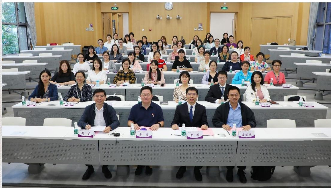
开班式全体人员合影

“清华大学科研管理创新赋能计划”是科研院结合近年来科研管理人员培训的需求，在人事处职工发展中心的指导和继续教育学院的支持下，拟通过两至三年的时间实现对全校的科研助理、科研秘书及相关部处机构单位的科研管理人员培训全覆盖。首期培训由面向院系科研助理的“业务提升模块”和面向