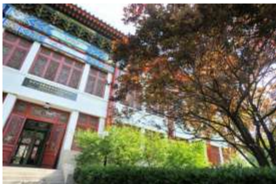
北京大学赛克勒考古与艺术博物馆外景

建馆 25 年以来，赛克勒博物馆不仅举办了“千年敦煌——敦煌壁画艺术精品高校巡展”“华夏遗韵——中原古代音乐文物展”“寻找致远舰——2015 年度全国十大考古新发现”“大师印记：从丢勒到毕加索”“锦上胡风——丝绸之路魏唐纺织品上的西方影响”等重量级展览，还凭借得天独厚的学术和研究环境，为中国的考古事业作出了重要贡献。