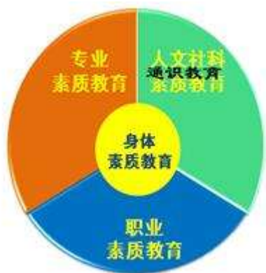
图 1 素质教育模式图

身体素质教育是基础。首要是养成健康的习惯、享有健康的环境，还要有运动调节心力和体力，保持身心平衡，通过体育课程改革和教学实践提升在校生身体素质。射击、驾驶、攀岩、民族舞蹈等都应该成为现代体育教育的主要内容。特别是射击和驾驶射击驾驶要与军训衔接起来，并成为公民教育的重要环节。“射者，必正其身”，要命中目标就必须保持正确的姿态和坚定的心境。大学生对于现代交通技术应该有正确的知识和能力，驾驶不仅是技能和体能的培养，而且在社会秩序上亦有重要的意义。目前广为实施的体育课程中的球类、操类、赛跑等都有其规则，一方面是增强学生体质，另一方面是锻炼学生品质，养成其守规、合作与服务的精神。因此，身体素质教育要使学生