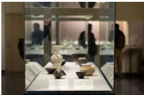
观众在北京大学赛克勒考古与艺术博物馆里参观