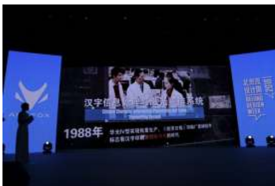
2018 北京国际设计周颁奖现场

新技术成果，占据了海外华文报业 90% 的市场。王选的发明被誉为“毕昇发明活字印刷术后中国印刷术的第二次革命”，引发了我国报业和印刷出版业“告别铅与火，迈入光与电”的技术革命，为中国印刷设计开辟了创新之路，为信息时代汉字和中华文化的传承与发展创造了条件，成为自主创新和运用高新技术设计改造传统行业的典范。