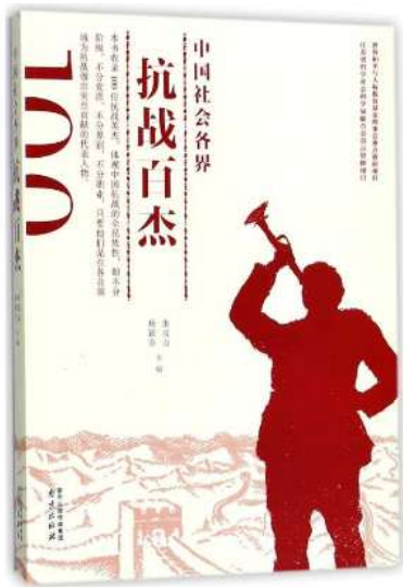
中国社会各界抗战百杰